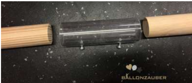
3 STÄBE MIT 2 ACRYL-ROHREN VERBINDEN/EINSTECKEN/VERSCHRAUBEN