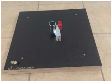
STANDFUSS M. STIELHALTER

( FUSS, 3 STÄBE, 2 ROHRE, 4 SCHR. U.1. KABELBINDER )