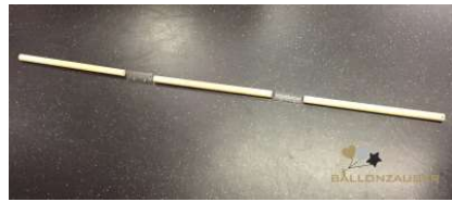
3 TLG STAB