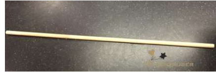
3 x 50 CM = 1,5 M