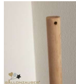
OBEN ! (BOHRUNG)